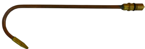
Рис.2 Наконечник медный обратный ДЖЕТ 116 02 00 00-(07...13)